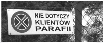
Tablica na parkingu parafii ewangelickiej