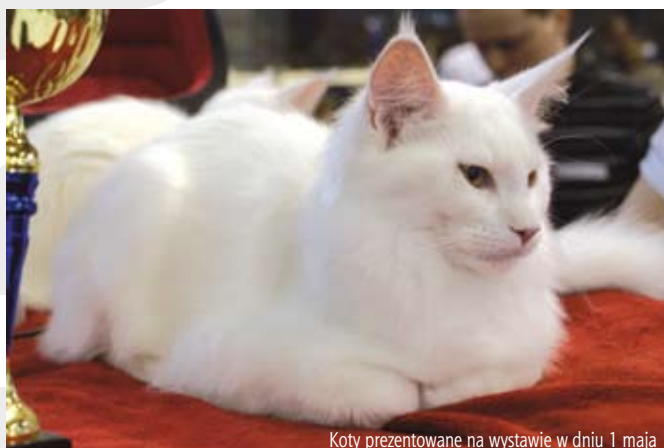
Koty prezentowane na wystawie w dniu 1 maja