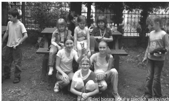
Dzieci biorące udział w zajęciach wakacyjnych