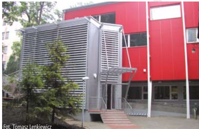
Fot. Tomasz Lenkiewicz