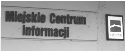
Po prawej zmodyfikowane logo Cieszyna