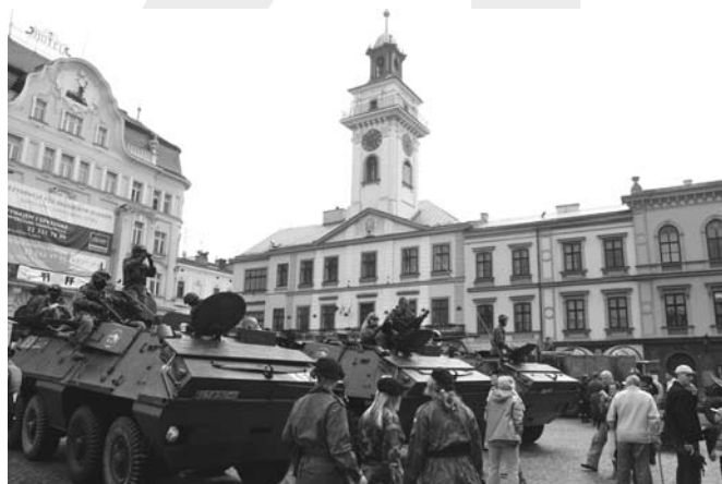
Pokaz sprzętu wojskowego na rynku