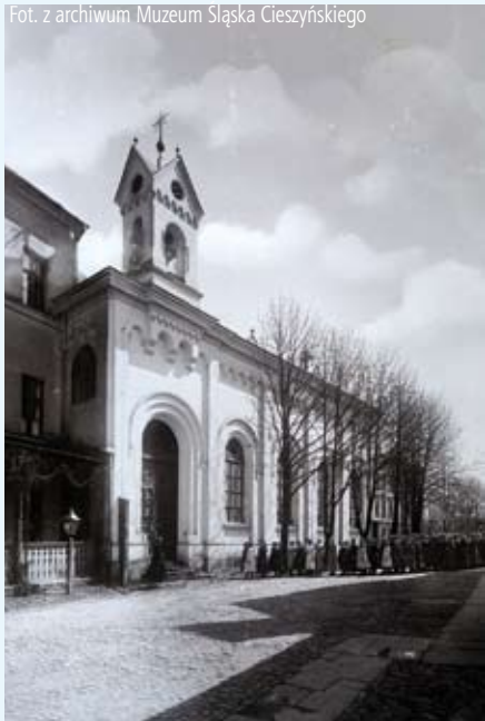
Kaplica pw. Świętej Rodziny, początek XX w.